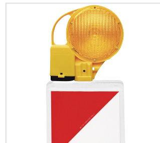
BakoLight auf Leitbake