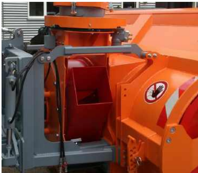
Drehschacht für freien Auswurf, 30% mehr Räumleistung