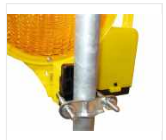
BakoLight mit Masthalter